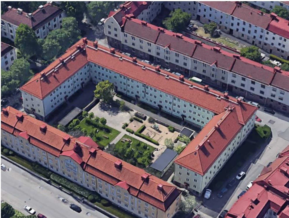
Amiralitetsgatan 24 (U-formad huskropp).